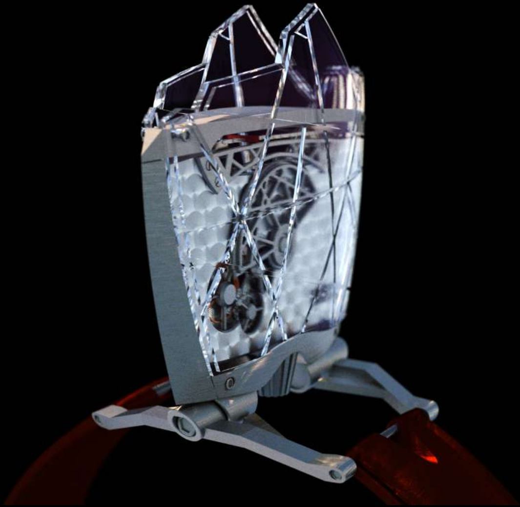
CACHEUX CATHEDRALE - face B