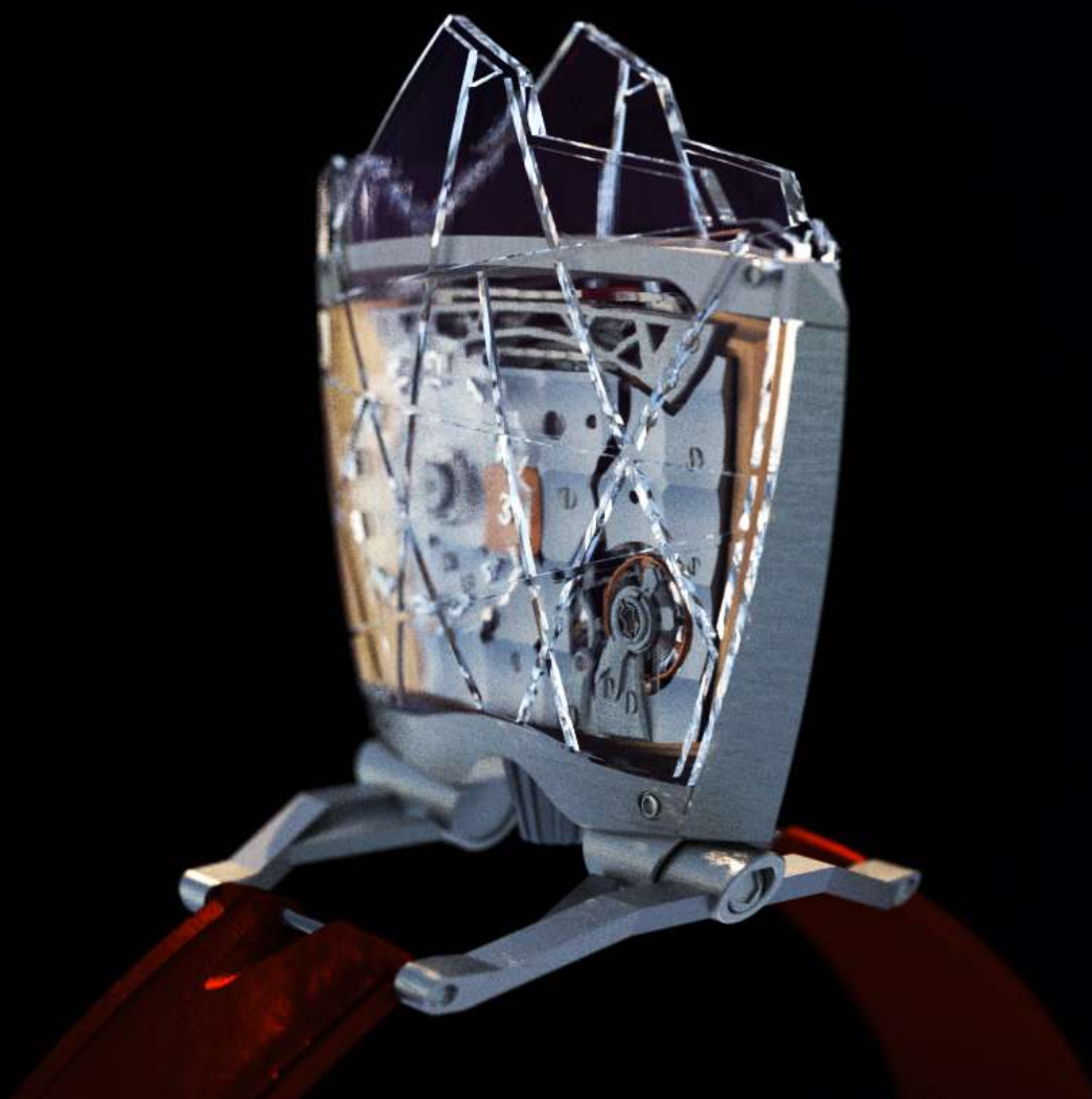
CACHEUX CATHEDRALE – face A